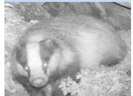
Photo d'un habitué de la pisciculture de Gesse ... un blaireau (Meles meles)